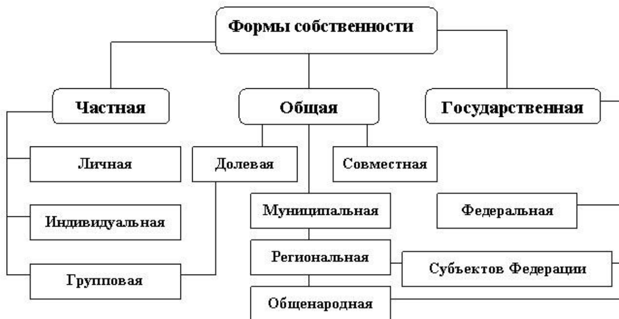
Рисунок 1 - Формы собственности 4