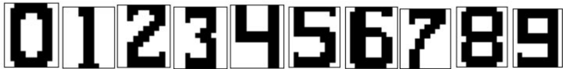
Рис. 4.1. Примеры графических символов цифр

На рис. 4.1 приведены примеры графических символов цифр при N1=10, N2=12 пикс.