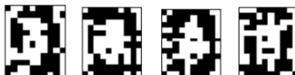
Рис. 4.3. Правильные распознавания символа «0», искаженного 20% шума «Соль и Перец», результат распознавания (слева направо):