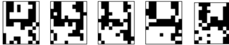
Рис. 4.5. Правильные распознавания символа «4», искаженного 20% шума «Соль и Перец», результат распознавания (слева направо): «4», «4», «4», «4», «4»