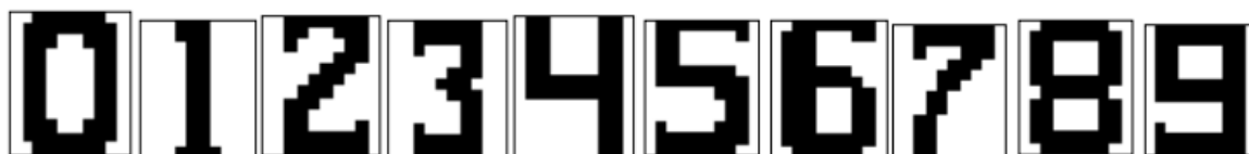
Рис. 4.1. Примеры графических символов цифр

На рис. 4.1 приведены примеры графических символов цифр при N1=10, N2=12 пикс.