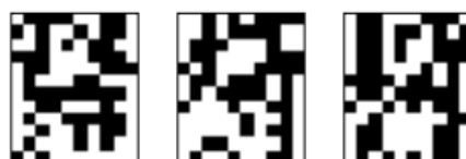
Рис. 4.4. Неверные распознавания символа «4», искаженного 20% шума «Соль и Перец», результат распознавания (слева направо):