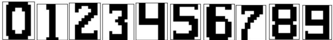
Рис. 4.1. Примеры графических символов цифр

На рис. 4.1 приведены примеры графических символов цифр при N1=10, N2=12 пикс.