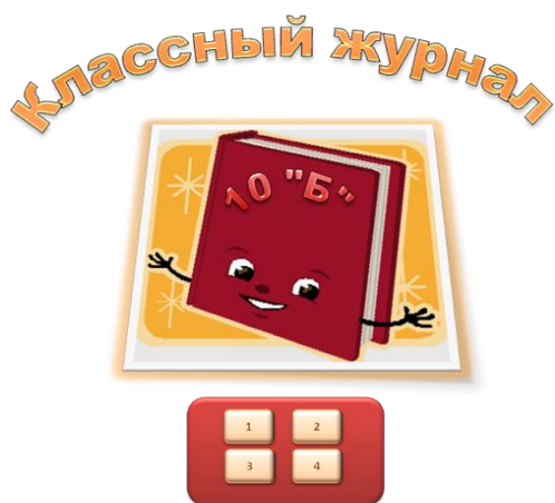
Рис 1. Пример оформления титульного листа.

Задание 15. На листе, содержащем сведения об учениках записать макрос, выполняющий настройку экрана: