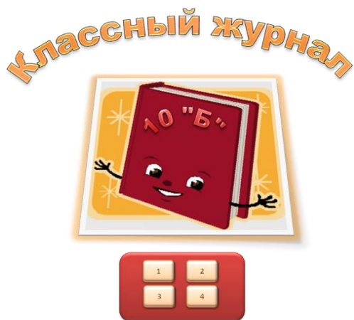
Рис 1. Пример оформления титульного листа.

Задание 15. На листе, содержащем сведения об учениках записать макрос, выполняющий настройку экрана: