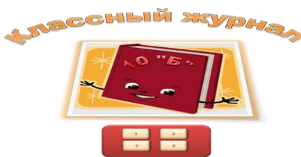
Рис 1. Пример оформления титульного листа.