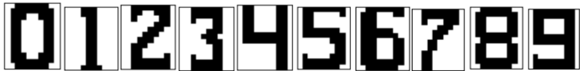
Рис. 4.1. Примеры графических символов цифр

На рис. 4.1 приведены примеры графических символов цифр при N1=10, N2=12 пикс.