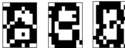
Рис. 4.6. Результаты распознавания символа «8», искаженного 10% шума «Соль и Перец», результат распознавания (слева направо): «8», «8», «6»

Результаты распознавания символов, представленные на рисунках 4.2-4.6, демонстрируют хорошее распознавание с помощью НС даже при сильном искажении (параметр p > 0,1 ). Для объективной оценки качества работы НС необходимо вычисление вероятностных характеристик распознавания. При правильном выборе параметров обучения сети и использовании не менее 100 обучающих образов можно получить вероятность правильного распознавания символов порядка 0,6...0,9 (в зависимости от вида распознаваемого символа) при параметре искажения p = 0,1 \dots 0,2 .