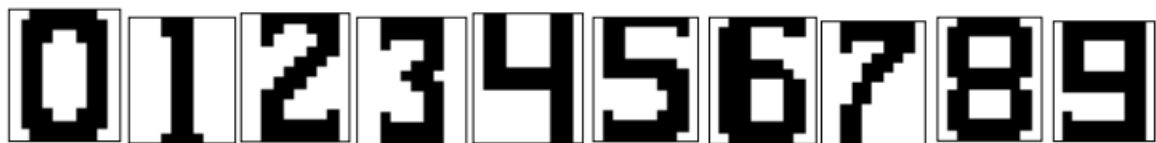
Рис. 4.1. Примеры графических символов цифр

На рис. 4.1 приведены примеры графических символов цифр при N1=10, N2=12 пикс.