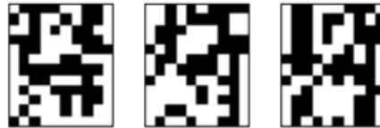
Рис. 4.4. Неверные распознавания символа «4», искаженного 20% шума «Соль и Перец», результат распознавания (слева направо): «3», «5», «6»