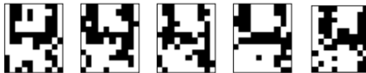
Рис. 4.5. Правильные распознавания символа «4», искаженного 20% шума «Соль и Перец», результат распознавания (слева направо): «4», «4», «4», «4», «4»