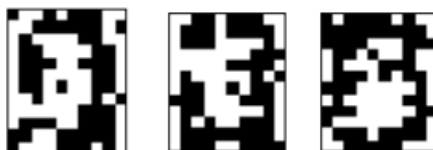
Рис. 4.2. Неверные распознавания символа «0», искаженного 20% шума «Соль и Перец», результат распознавания (слева направо): «2», «3», «5»

На рисунках 4.2-4.6 представлены некоторые примеры распознавания символов, изображенных на рис. 4.1, с помощью обученной НС. Обучение проводилось при числе обучающих образов M=10 для каждого вида символа и параметре искажения символов p=0,1 .