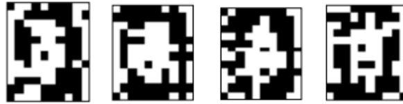
Рис. 4.3. Правильные распознавания символа «0», искаженного 20% шума «Соль и Перец», результат распознавания (слева направо): «0», «0», «0», «0»