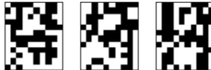
Рис. 4.4. Неверные распознавания символа «4», искаженного 20% шума «Соль и Перец», результат распознавания (слева направо): «3», «5», «6»